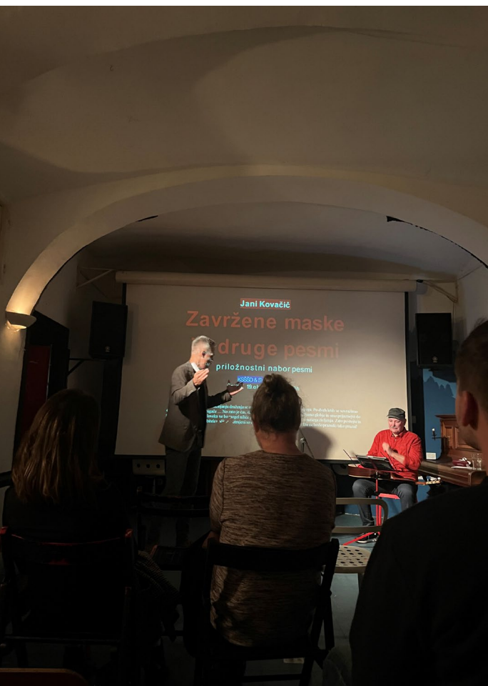
SKICA & KŠŠ na Dunaju