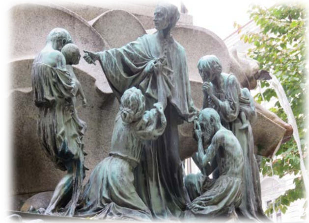
Vodnjak Karla Boromejskega