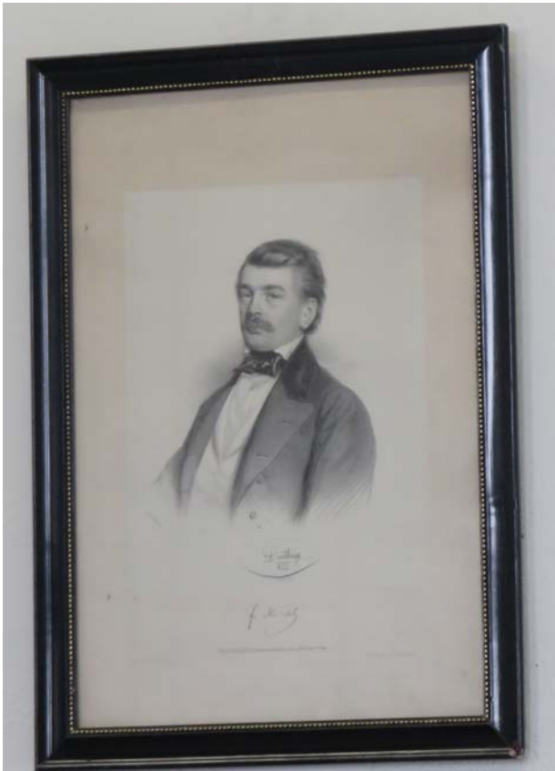
Franc Miklošič (1813–1891)