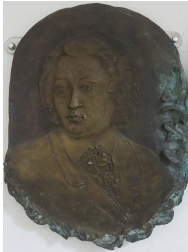
France Prešeren (1800–1849)