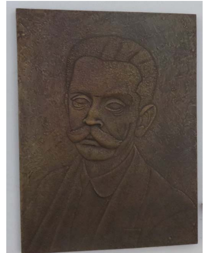
Ivan Cankar (1876–1918)